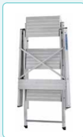
• PratiKo chiuso