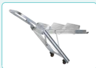
• Kit rotelle ■ COD: KITRUO