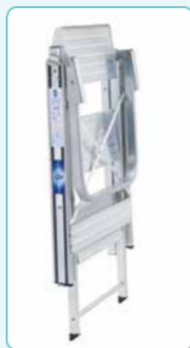
• Parapetto pieghevole ■ Altezza 50 cm